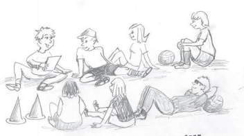
Halva laget – tycker till!