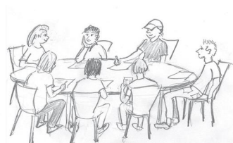
Halva laget – tycker till!